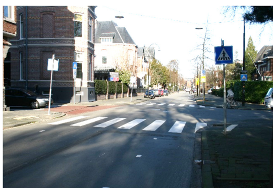
Singel – Vrieseweg