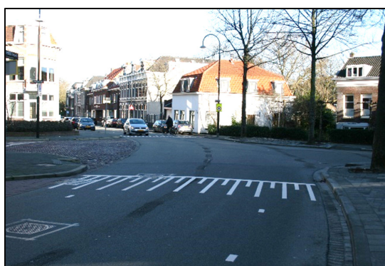
Nic. Maessingel – Dubbeldamseweg Nrd.

Het kruisingsvlak van de gelijkwaardige kruispunten zelf is leeg van markering. De optische versmallingen op de wegvakken (kleine streepjes op de rechtstanden) eindigen bij de taludmarkeringen. Het gelijkwaardige kruispunt Singel – Vrieseweg is momenteel herkenbaar door de vier voetgangersoversteekplaatsen (met zebra markering) op alle vier de toeleidende wegen.