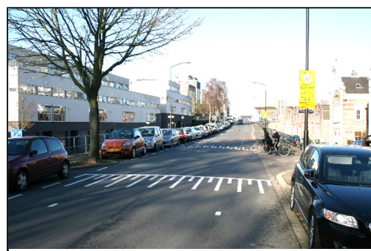
Groenedijk – Van Neurenburgpad