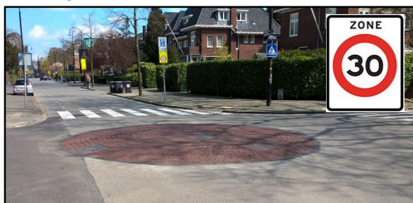
30 km zone: o.a. Singel, Stooplaan, Hallincqiaan en Groenedijk