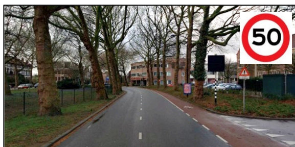
50 km 'centrumroute': Oranjelaan – Oranjepark – Burg. de Raadsingel