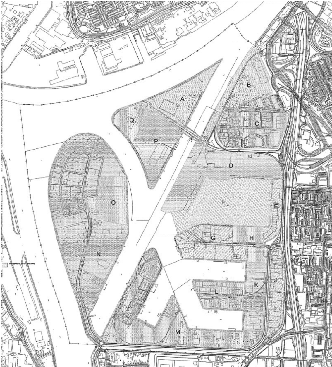
Figuur 1.2 Uitsnede bijlage 1 regels vigerende bestemmingsplan, tekening deelgebieden

Het plangebied betreft de deelgebieden D en F uit bijlage 1 van de regels van bestemmingsplan 'Zeehavens Dordrecht'. Deelgebied D is gelegen aan de 's-Gravendeelsdijk 175 in Dordrecht en betreft de huidige, bestaande terminal van ZHD. Deelgebied F beslaat de direct aangrenzend gelegen Wilhelminahaven.