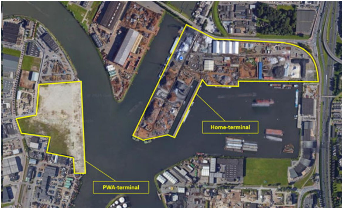
Figuur 2.1 Ligging van de Hometerminal en de PWA-terminal

De bestaande terminal van ZHD aan de 's-Gravendeelsedijk 175 (hierna: Hometerminal) heeft een omvang van circa 18 hectare en deze zal worden uitgebreid met de PWA-terminal, met een omvang van circa 8 hectare. De locatie en omgeving van de Hometerminal en PWA-terminal zijn weergegeven in figuur 2.1.