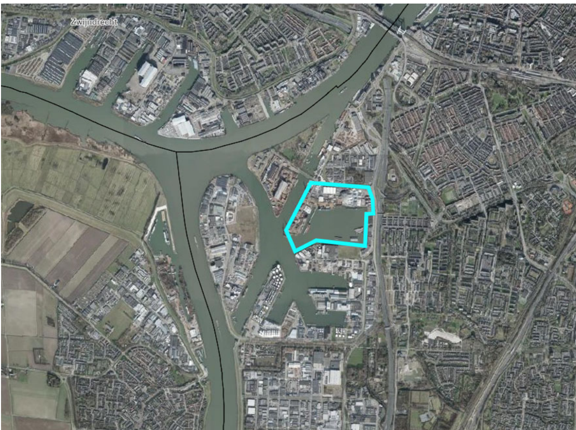
Figuur 1.1 Plangebied (blauwe contour)

Het bestemmingsplan 'Zeehavens Dordrecht' voorziet in de mogelijkheid om de geluidruimte via een wijzigingsprocedure te herverdelen. Om die reden is het voorliggende wijzigingsplan opgesteld. Het wijzigingsplan heeft betrekking op de locatie van de huidige terminal en de aangrenzende Wilhelminahaven.