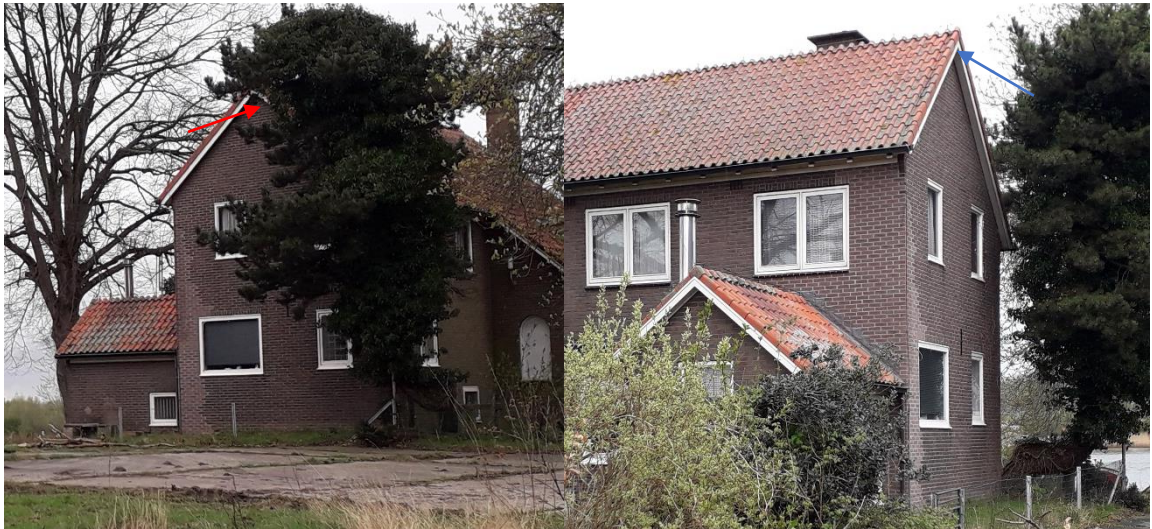
Figuur 5: Vindplaatsen van de uitvliegende vleermuizen. Links is de locatie waar de Ruige dwergvleermuis is uitgevlogen (rode pijl) en rechts de Gewone dwergvleermuis (blauwe pijl).