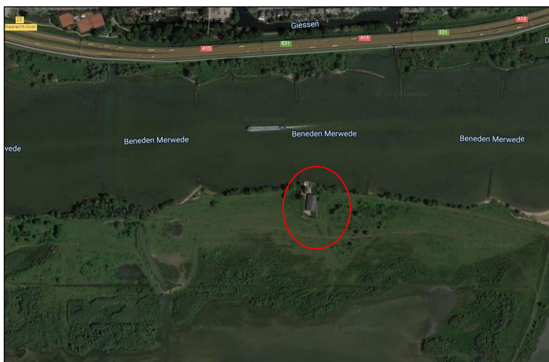
Figuur 1: Ligging van het plangebied (rood omlijnd).

Het plangebied is gelegen aan de Merwelanden 15 in Dordrecht (Zuid-Holland; figuur 1). Het plangebied is gelegen in de Sliedrechtse Biesbos en ligt binnen aan Natura 2000 gebied Biesbosch. Het plangebied zelf maakt geen onderdeel uit van het Natura 2000 gebied (figuur 1). Op het terrein staan 2 gebouwen, een woonhuis en een schuur. Voor dit aanvullend onderzoek is alleen het woonhuis meegenomen binnen het plangebied. Het plangebied ligt aangrenzend aan Beneden Merwede in de Merwelanden. Rondom het pand zijn enkele bomen aanwezig. de directe omgeving is gekenmerkt door graslanden en lage begroeiing.