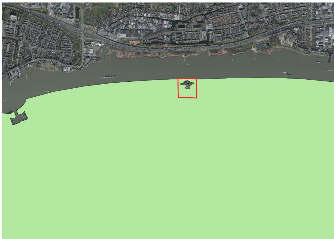
Figuur 2; ligging plangebied (rood omlijnd) ten opzichte van Natura 2000 gebied Biesbosch (aangegeven in groen).