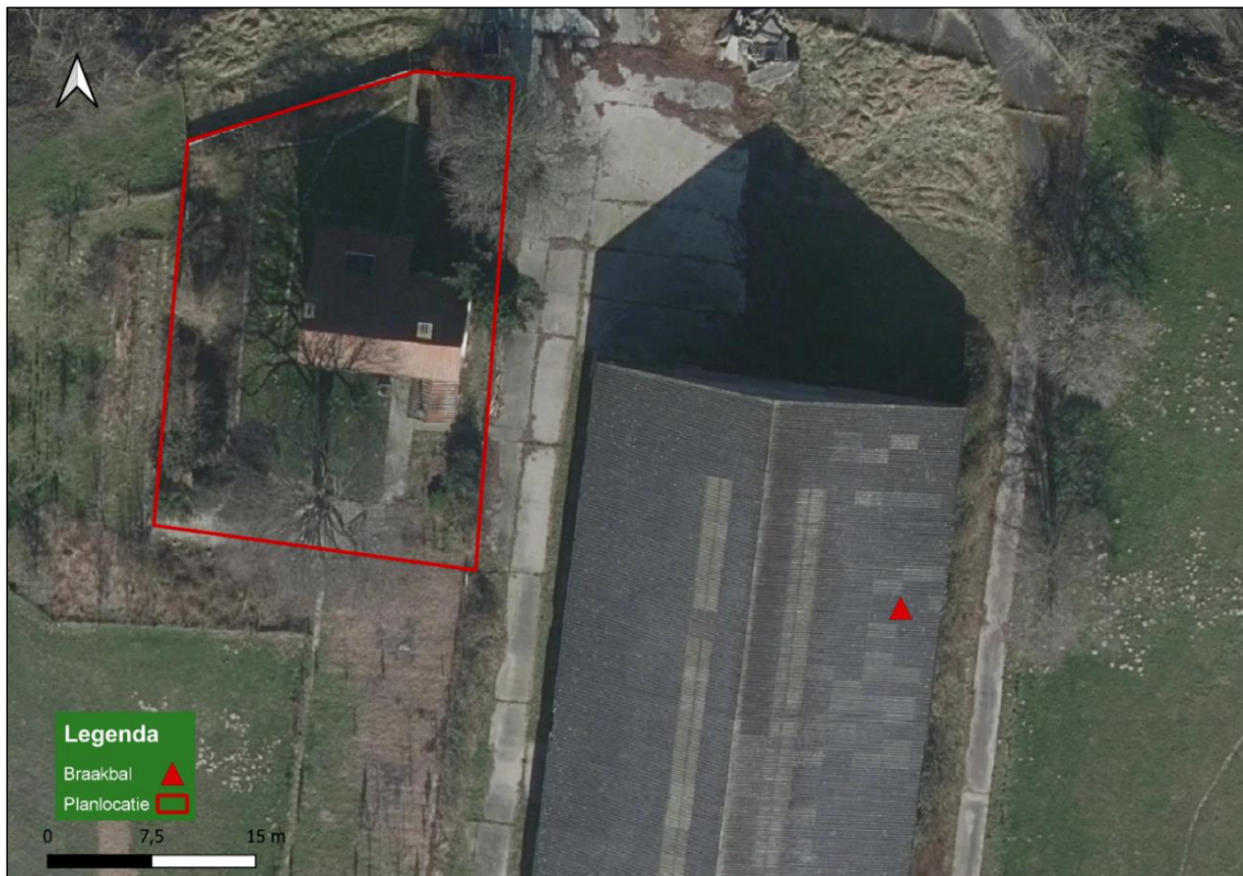
Figuur 6: Locatie van de gevonden braakbal ten opzichte van het plangebied.

Gedurende de veldbezoeken is er enkel op 15 juni 2022 een Gierzwaluw aangetroffen binnen het plangebied. Deze vloog over vanuit zuidwestelijke richting Hardinxveld. Er zijn geen huismussen aangetroffen tijdens de inventarisaties. Daarnaast is een braakbal aangetroffen nabij het plangebied (figuur 6). Deze is in de schuur gevonden.