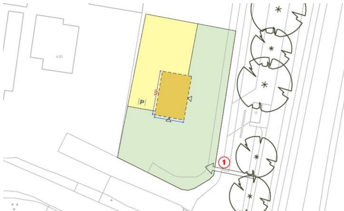
Randvoorwaarden tekening