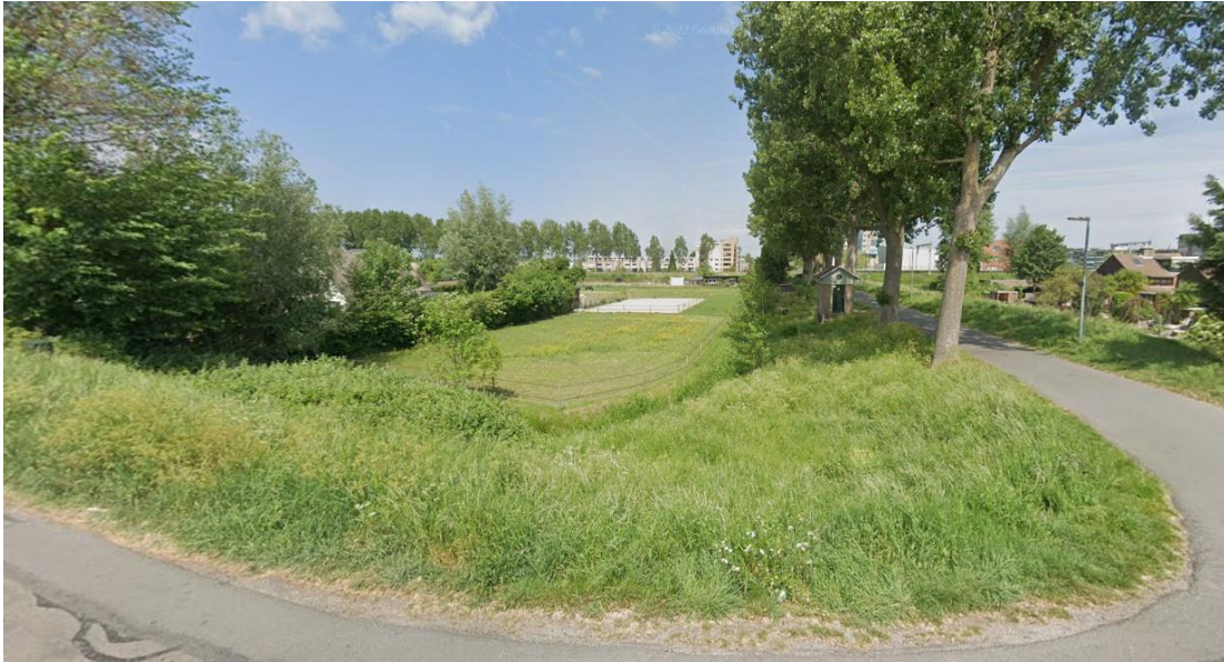
Huidige situatie aanzicht vanaf de Noordendijk