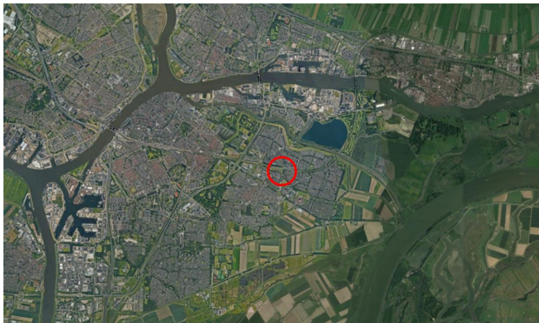
Globale ligging plangebied, rood omcirkeld

De navolgende afbeelding toont de ligging en de begrenzing van het plangebied.