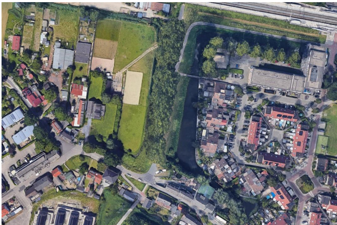
Huidige situatie luchtfoto

De navolgende afbeeldingen tonen een luchtfoto en impressie van de huidige situatie.