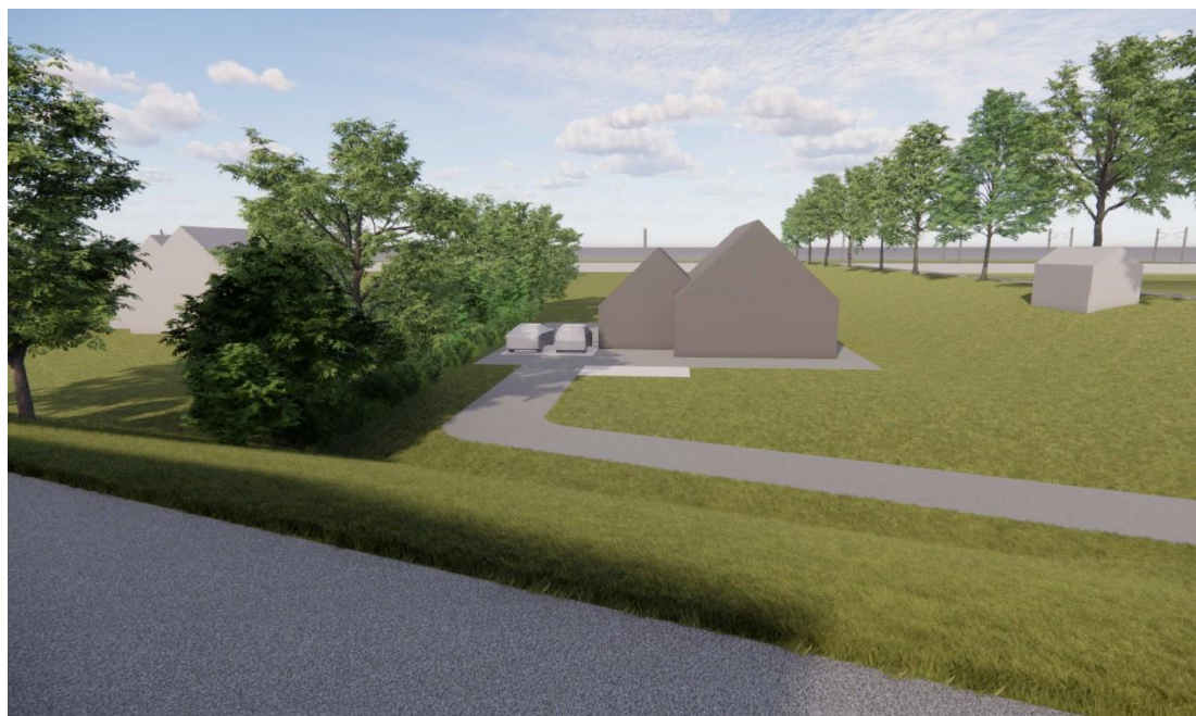
Toekomstige situatie plangebied