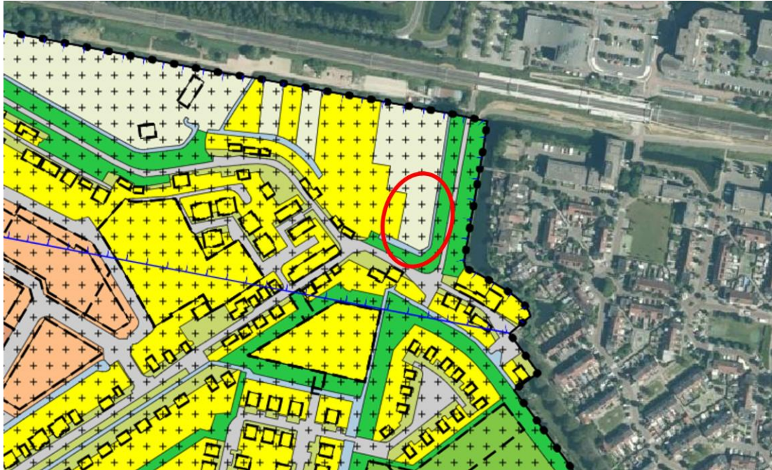
Uitsnede geldend bestemmingsplan 'Dubbeldam' (plangebied is rood omkaderd)

In dit bestemmingsplan beschikken deze gronden over de bestemming 'Agrarisch'. De gronden zijn onder andere bestemd voor agrarische bedrijven en een dienstwoning. Binnen de bestemming 'Agrarisch' is het niet mogelijk om een vrijstaande woning te bouwen.