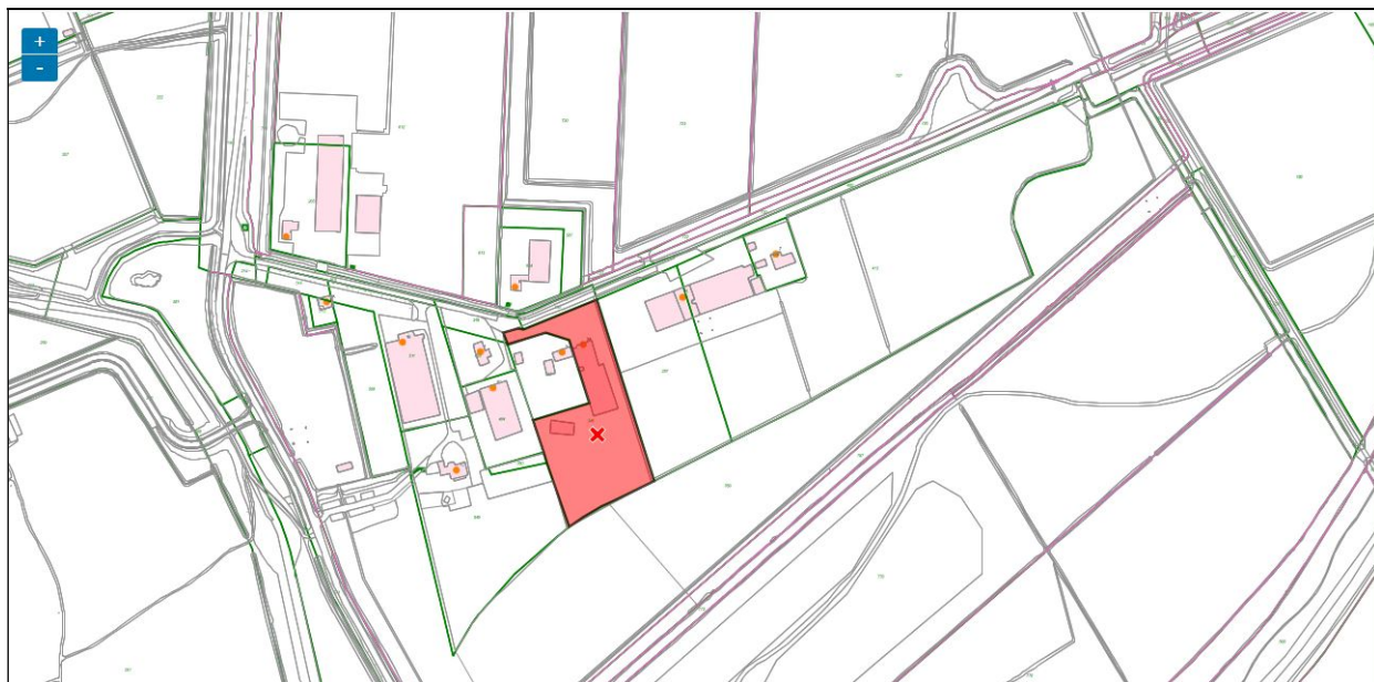
Het rode perceel X346 (nr 3A) omarmt X345 (nr. 3)