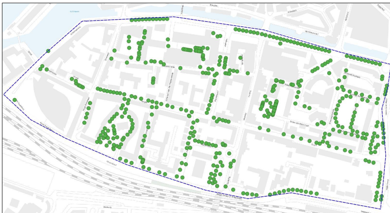
Figuur 7. De locaties van geregistreerde bomen in Schil-West.

In gebied Schil-West staan 492 geregistreerde bomen, verdeeld over 40 soorten en enkele variëteiten (Tabel 4). Voor deze bomen is vastgesteld of zij in potentie strikt beschermde ecologische waarden hebben. Het gaat met name om potentieel gebruik als vaste rust- of verblijfplaats van strikt beschermde diersoorten, of een andere beschermde functie voor dergelijke soorten. De verspreiding van de beoordeelde bomen is weergegeven in figuur 7.