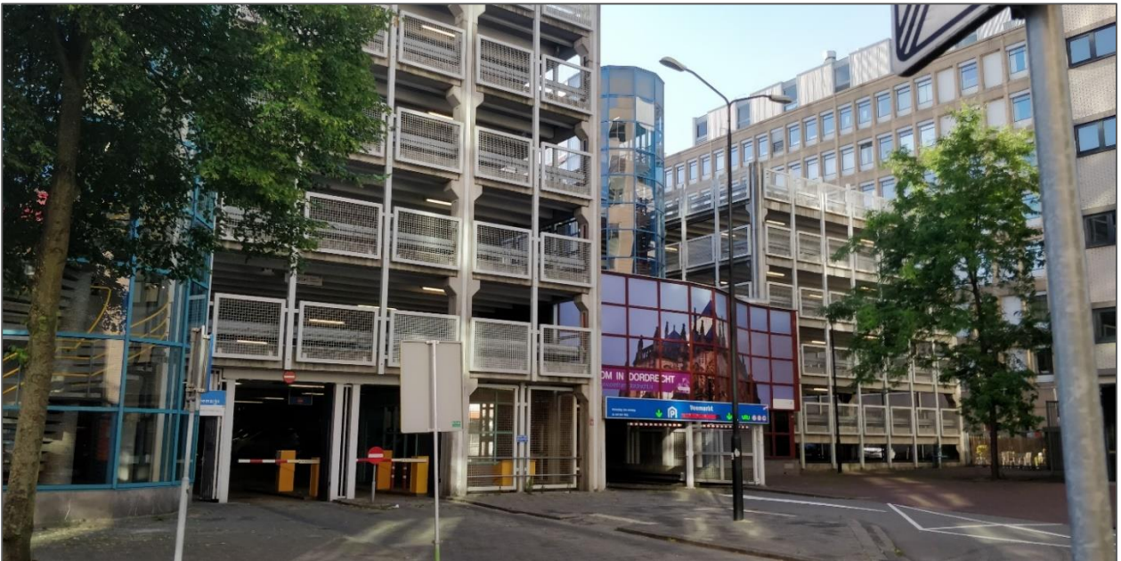
Figuur 6. Vooraanzicht van parkeergarage Veemarkt. Hier zijn geen beschermde ecologische waarden te verwachten.