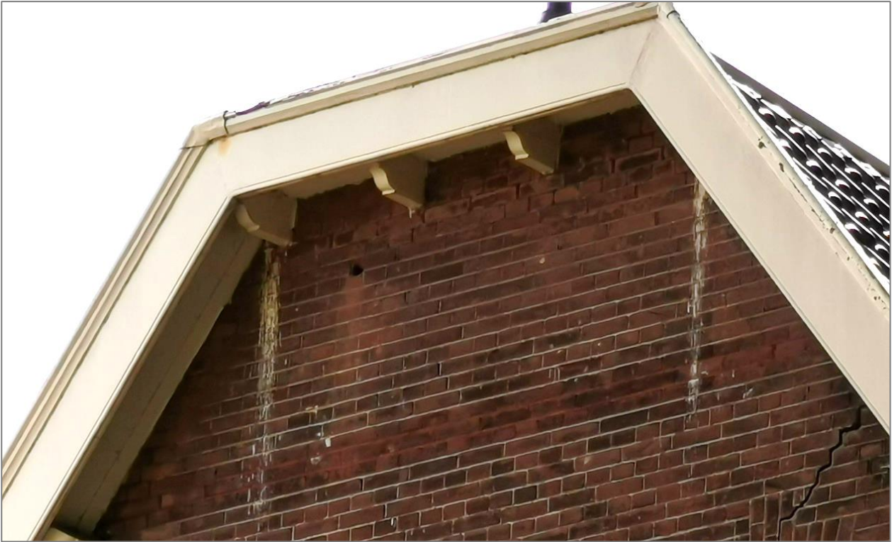
Figuur 5. Meststrepen onder de dakrand van een 19 e -eeuwse woning in Schil-West. Mogelijke nestlocaties van Huismussen Passer domesticus .