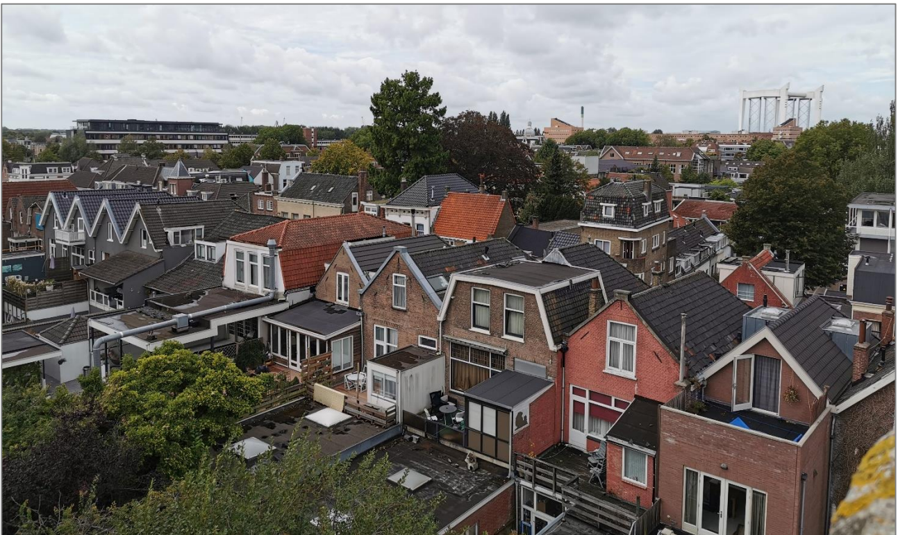
Figuur 2. Zicht op een deel van Schil-West, Dordrecht, met 19 e -eeuwse laagbouw op de voorgrond (zie ook deels later aanbouw) en enkele naoorlogse hoogbouwelementen op de achtergrond.

De naoorlogse bouwwerken vertonen een brede architectonische diversiteit. In deze objecten worden geregeld spouwmuren, betonplaten, kunststof afwerkingen en glazen gevels aangetroffen. Daarnaast is in deze categorie veel sprake van hoogbouw. Hoewel deze structuren verschillen van de 19 e -eeuwse bouwstijl, zijn ook hier ecologische waarden te verwachten voor met name vogels en vleermuizen.