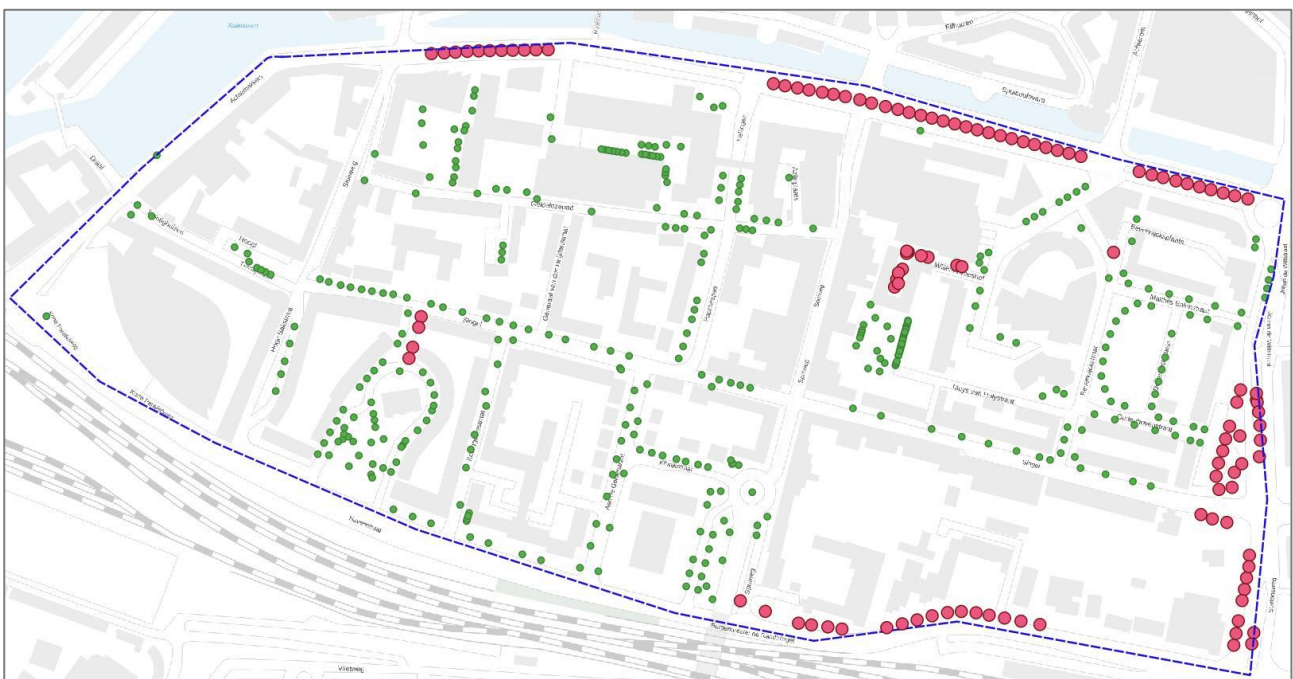
Figuur 9. Bomen in Schil-West die mogelijke beschuttende elementen voor vleermuizen zijn (waaronder vliegroutes), worden als roze stippen weergegeven.

Er zijn verschillende potentiële vliegroutes geïdentificeerd, voornamelijk aan de randen van het gebied Schil-West. Langs de Spuiboulevard bieden de bomen mogelijk beschutting aan vleermuizen die boven de watergang op insecten jagen. Het gaat daarbij mogelijk om zowel windluwte als om afscherming van kunstlicht. Ook de in figuur 9 aangeduide bomen aan de Burgemeester de Raadsingel en de Stationsweg en