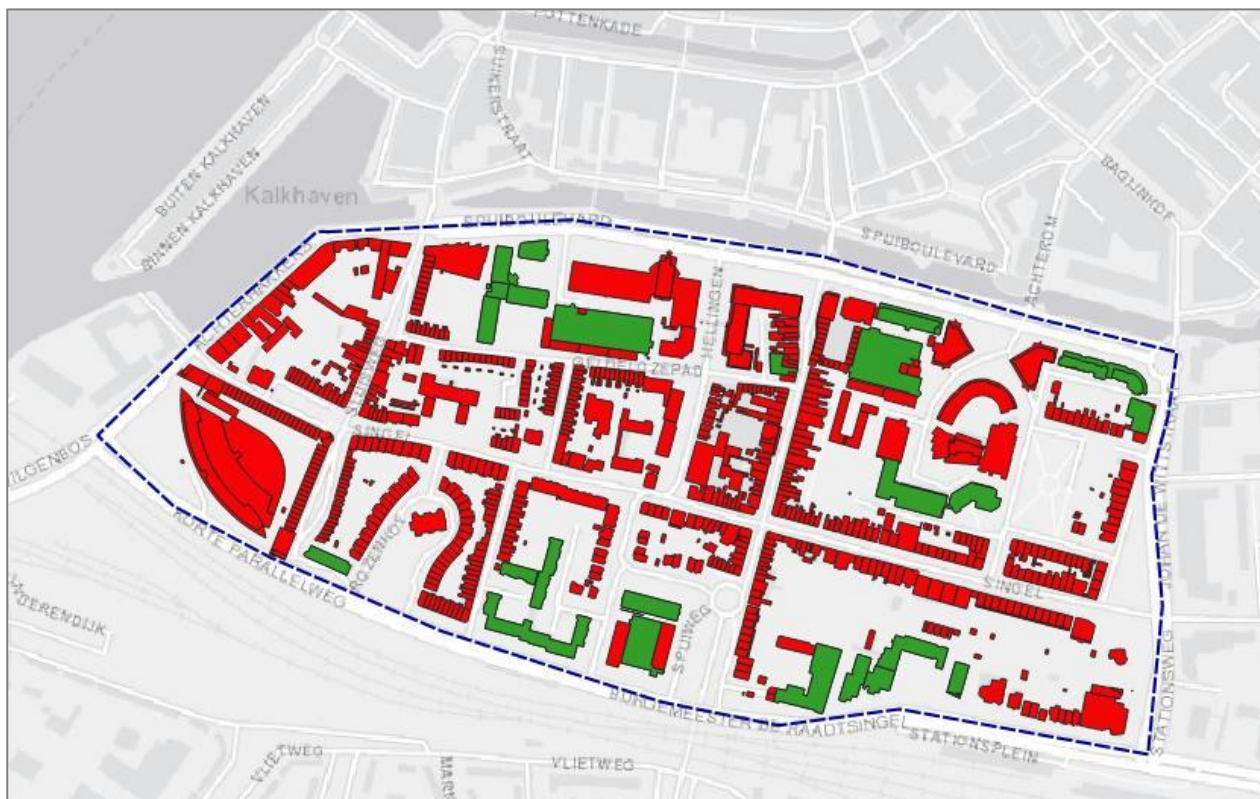
Figuur 4. De ecologische potenties van de gebouwen in het plangebied, aangeduid met rood (hoge potentie, nader onderzoek vrijwel zeker nodig) en groen (lage potentie, een quick scan is vrijwel zeker voldoende).

Gewone dwergvleermuis en de Ruige dwergvleermuis is dit bouwtype des te interessanter. Met name waar spouwmuren met open stootvoegen beschikbaar zijn, is de kans op vestiging groot (Voortman & Bakker 2020). Omdat in deze categorie ook sprake is van hoogbouw die boven de omringende bebouwing uitsteekt ontstaan kansen voor de Slechtvalk, al is het vestigingsrisico voor deze roofvogel betrekkelijk laag.