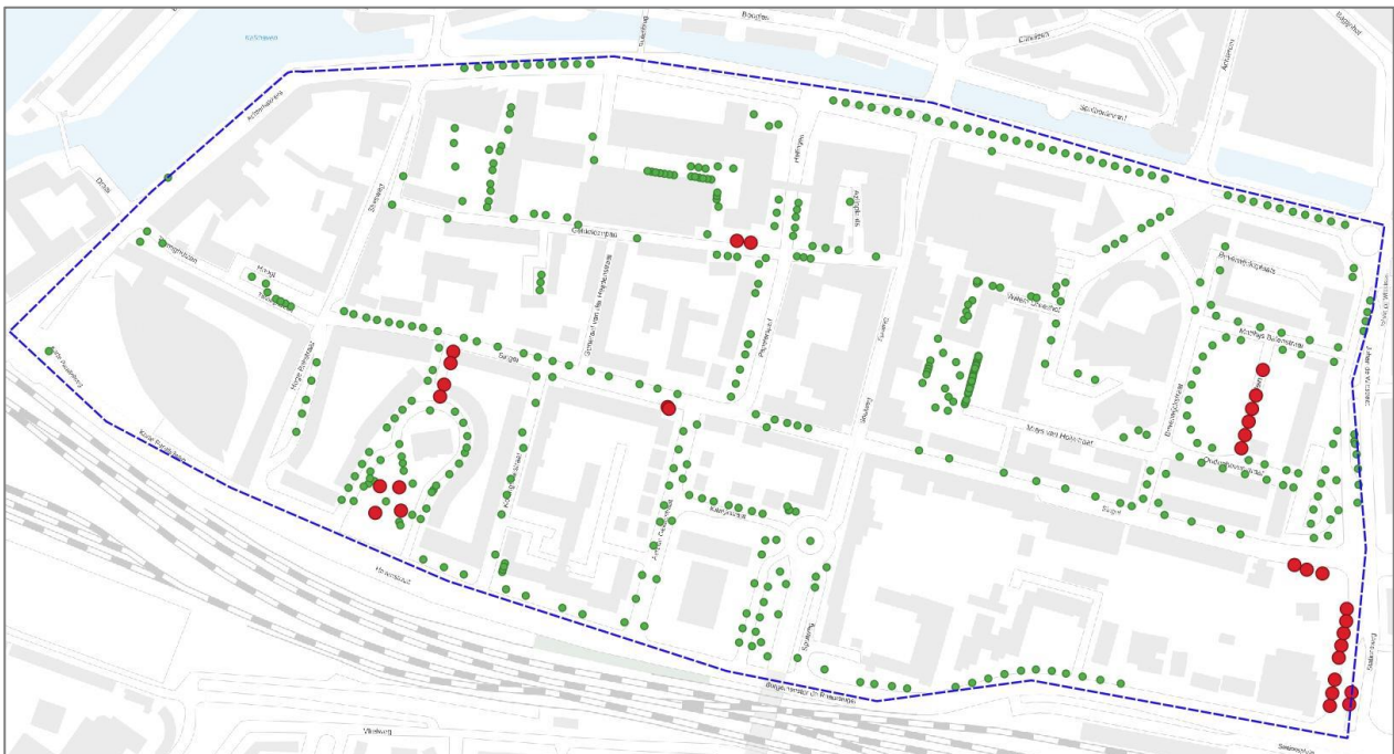
Figuur 8. Bomen met potenties voor verblijven van vleermuizen in gebied Schil-West. Deze bomen dienen vooraf gecontroleerd te worden op de aanwezigheid van geschikte holtes wanneer sprake is van kap- en snoeiwerk.

afschermen van een lichtbron) zijn ook bomen nabij een invliegopening van een vleermuiskolonie in een gebouw soms van essentieel belang voor het behoud van die kolonie. Bomen met een mogelijke beschuttingsfunctie (veelal vliegroutes) zijn weergegeven in figuur 9.