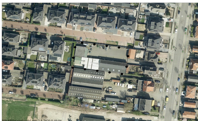
kaartje begrenzing plangebied