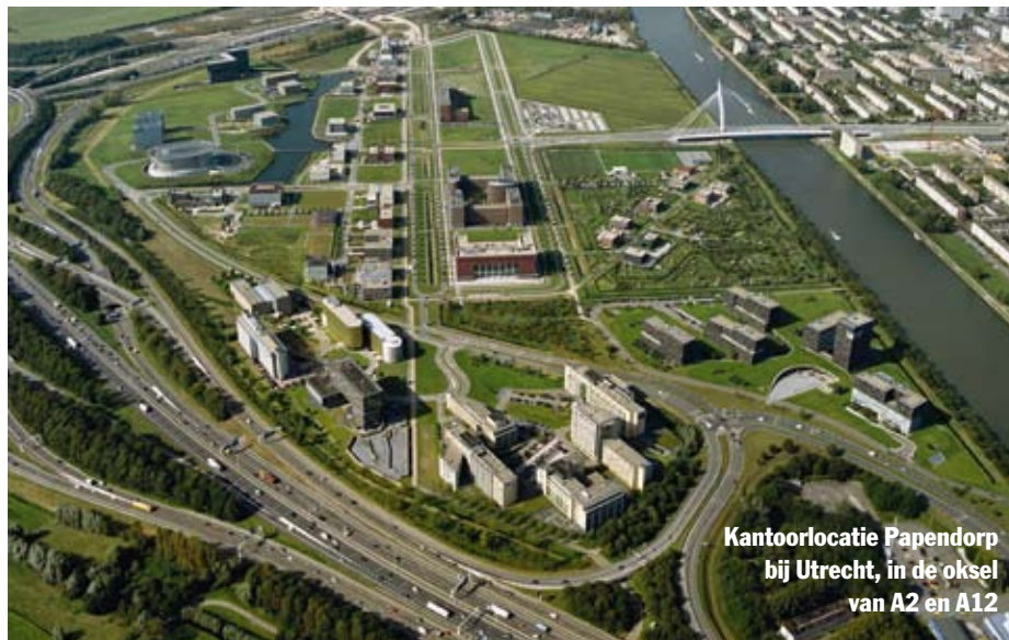
Kantoorlocatie Papendorp bij Utrecht, in de oksel van A2 en A12

Voor toelichting bij de berekeningen: www.elsevier.nl/toplocaties2009