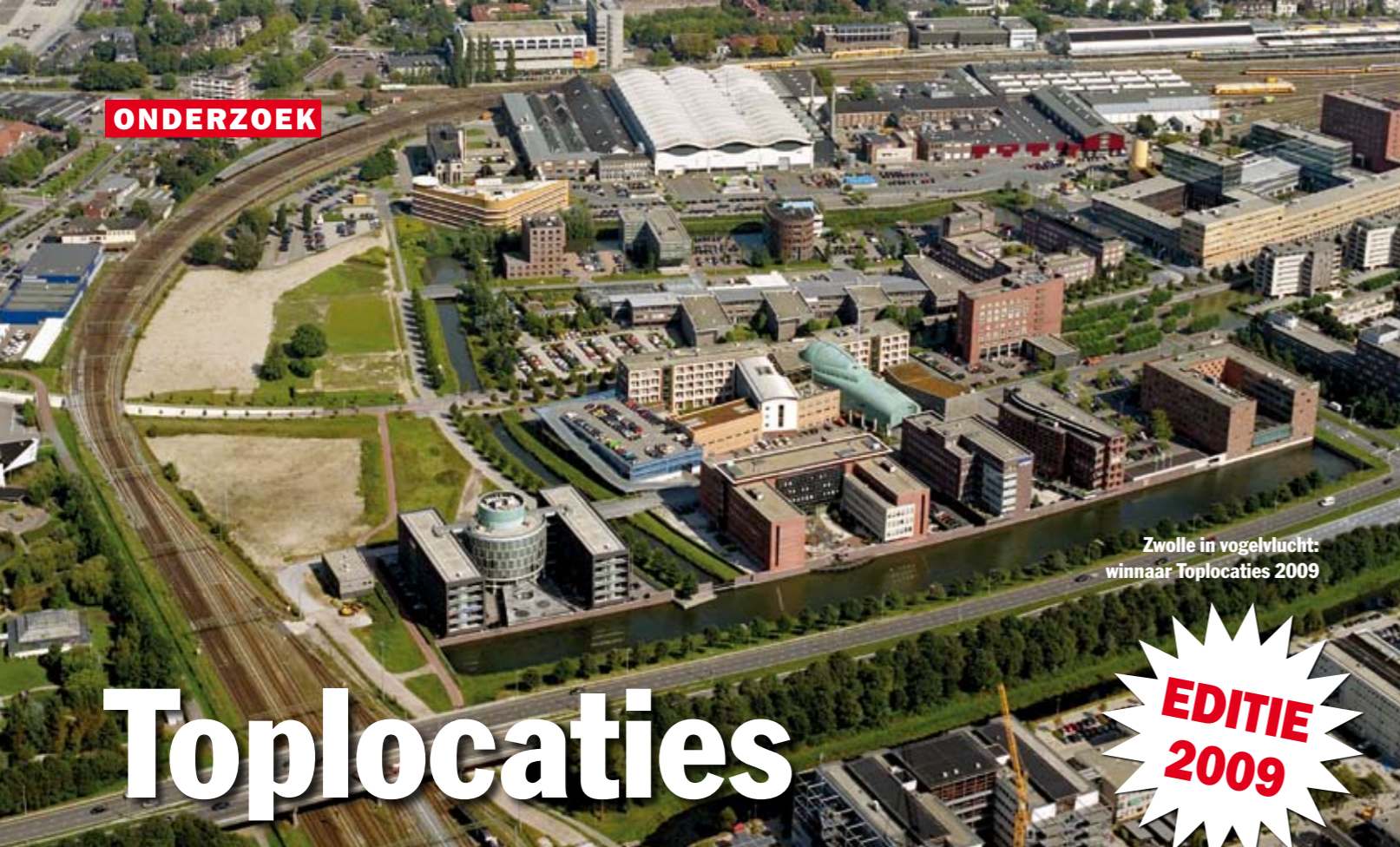
Zwolle in vogelvlucht: winnaar Toplocaties 2009