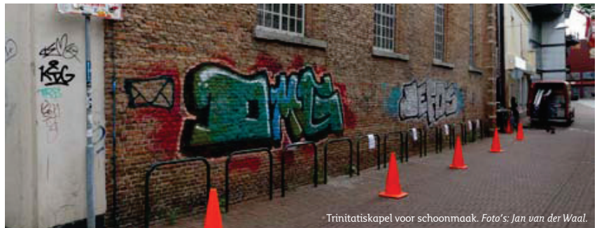
Trinitatiskapel voor schoonmaak.