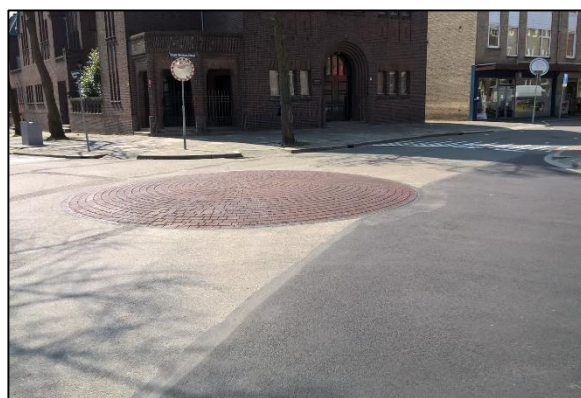
'punaise' op een vierarmig kruispunt

Iedereen kan en mag over de punaise heenrijden, ook een fietser! De normale verkeersregels blijven van toepassing: het blijft een normale gelijkwaardige kruising waarbij bestuurders van rechts voorrang hebben . Er is alleen een kleine bolling in het midden met een rood klinkermotief aangebracht. Belangrijk voordeel van de punaise is dat dit een trillingsvriendelijke oplossing is. Daarnaast geeft een punaise een zeker sturend effect op het verkeer. Dat kan de verkeersafwikkeling ten goede komen in situaties dat er verkeer van alle kanten komt.