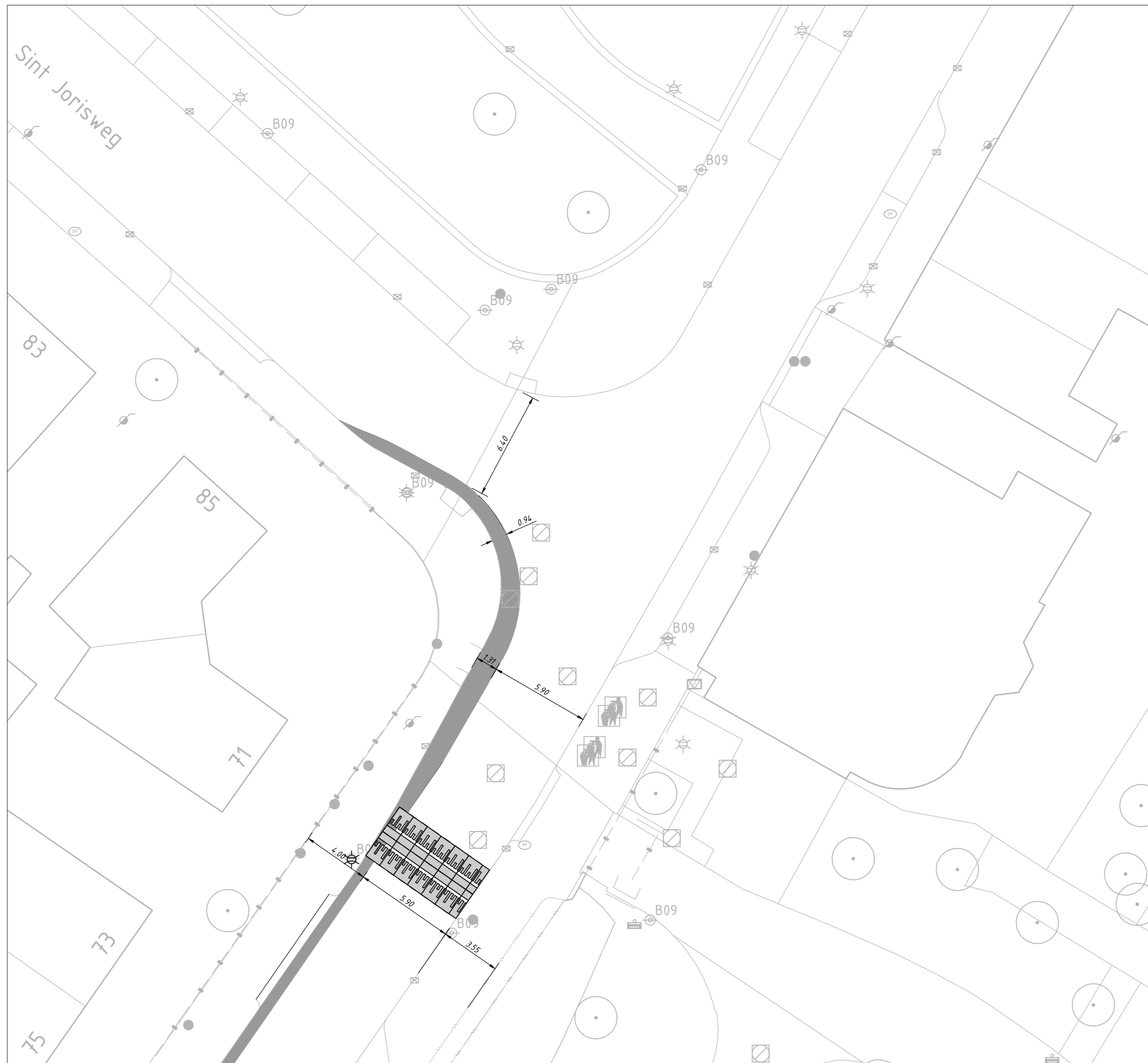
Kruising S van Hoogstratensingel - St Jorisweg schaal 1:200