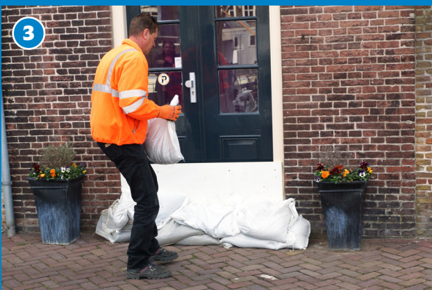
3 Leg een aantal zandzakken tegen het houten schot zodat het goed op zijn plek blijft.