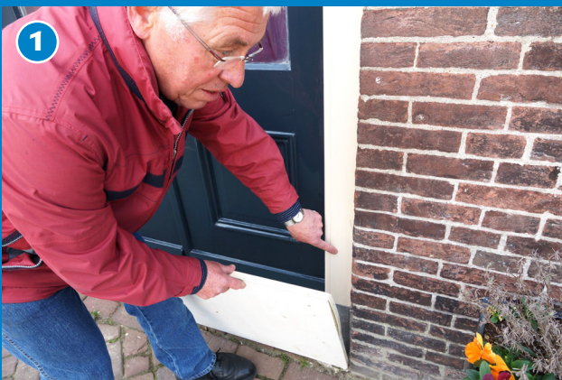
1 Breng een laagje klei aan tegen de drempel en de deurpost.