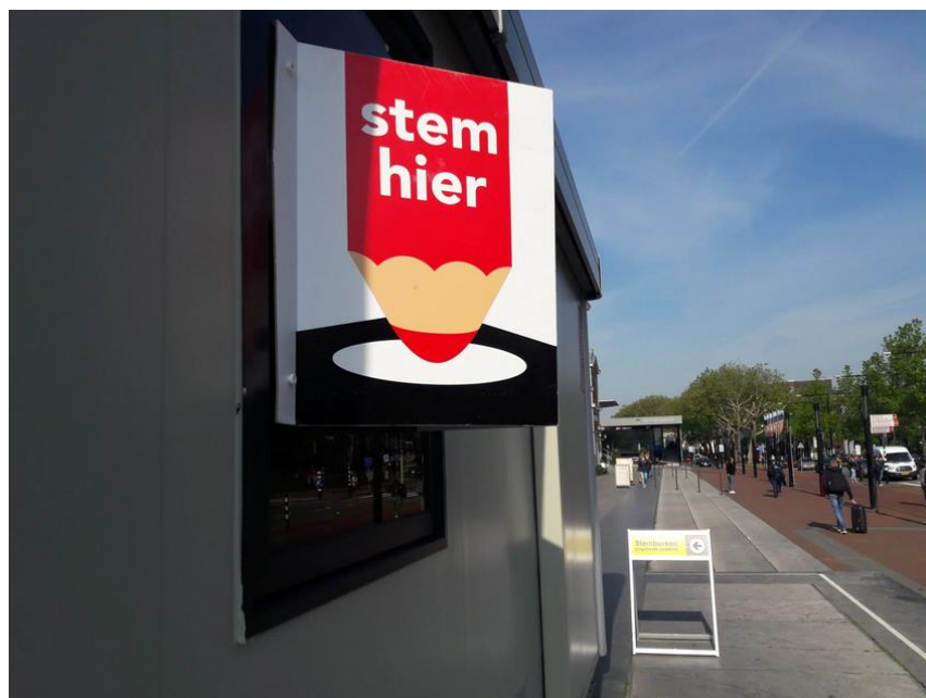
Stembureau bij station Dordrecht

Het onderwerp voor dit onderzoek wordt bepaald op basis van gesprekken met de nieuwe raad en de nieuwe raadsleden. Op die manier wil de Rekenkamercommissie de verbinding blijven zoeken met de gemeenteraad en benadrukken dat Rekenkameronderzoek een instrument is van en voor de gemeenteraad.