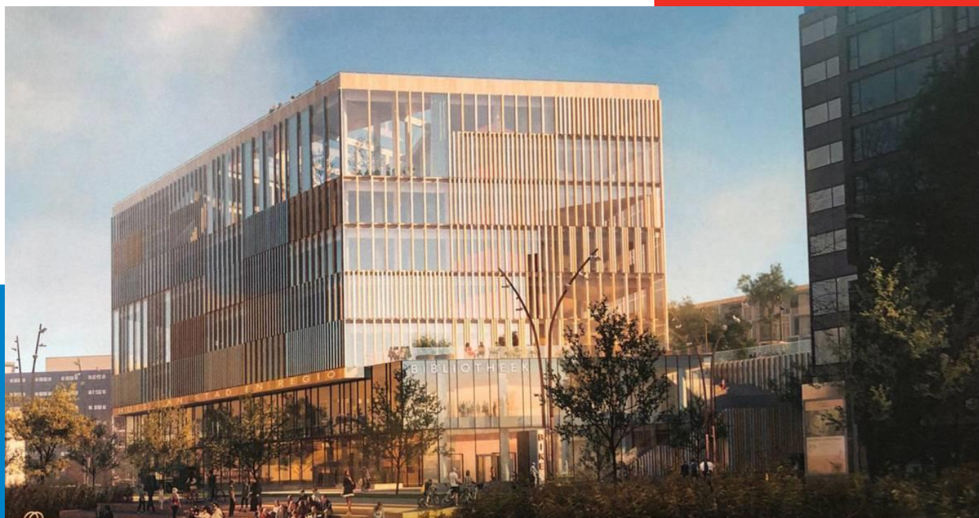
Huis van Stad en Regio Dordrecht door Schmidt Hammer Lassen

Dit jaar ligt de focus van het DoeMee onderzoek van de NVVR op de verduurzaming van overheidsgebouwen. Er moet nog een verdieping komen v.w.b.t. de onderzoeksopzet. Aan de hand daarvan bepalen wij of we deelnemen. De verwachting is dat we daar in kwartaal III meer duidelijkheid over hebben.