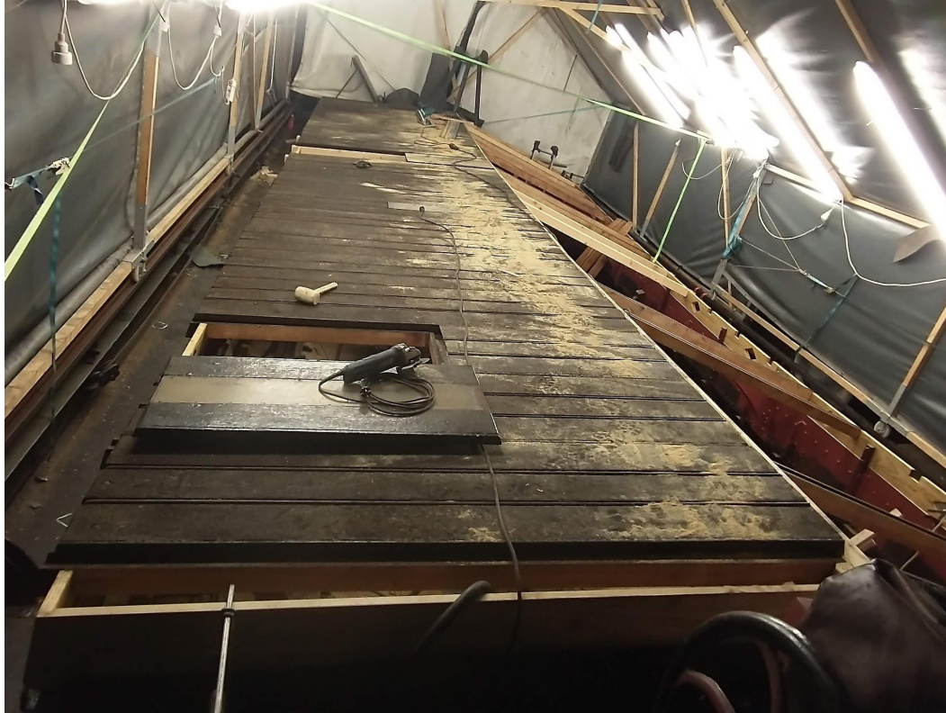
De stuurboordzijde van de kap kan weer dicht