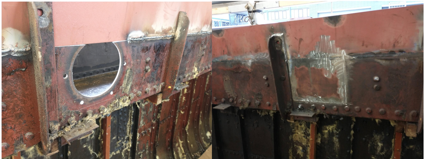
Patrijspoort in de oude den verwijderen