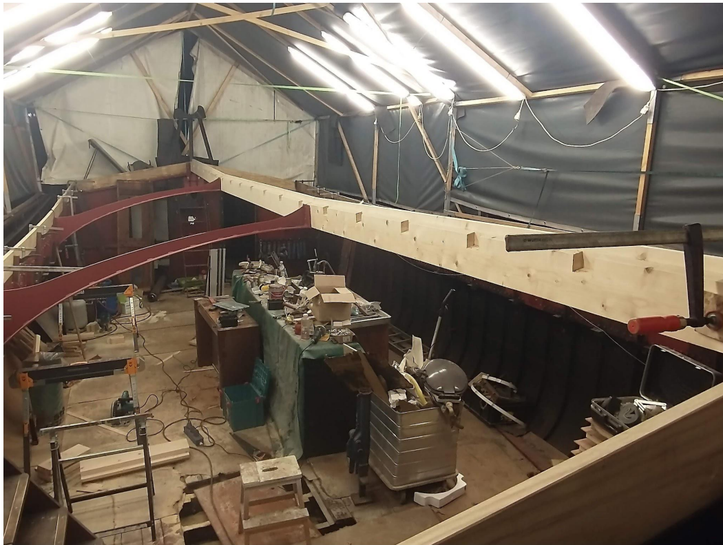
Nieuwe gebinten gemonteerd, nieuwe scheerbalken ingehangen