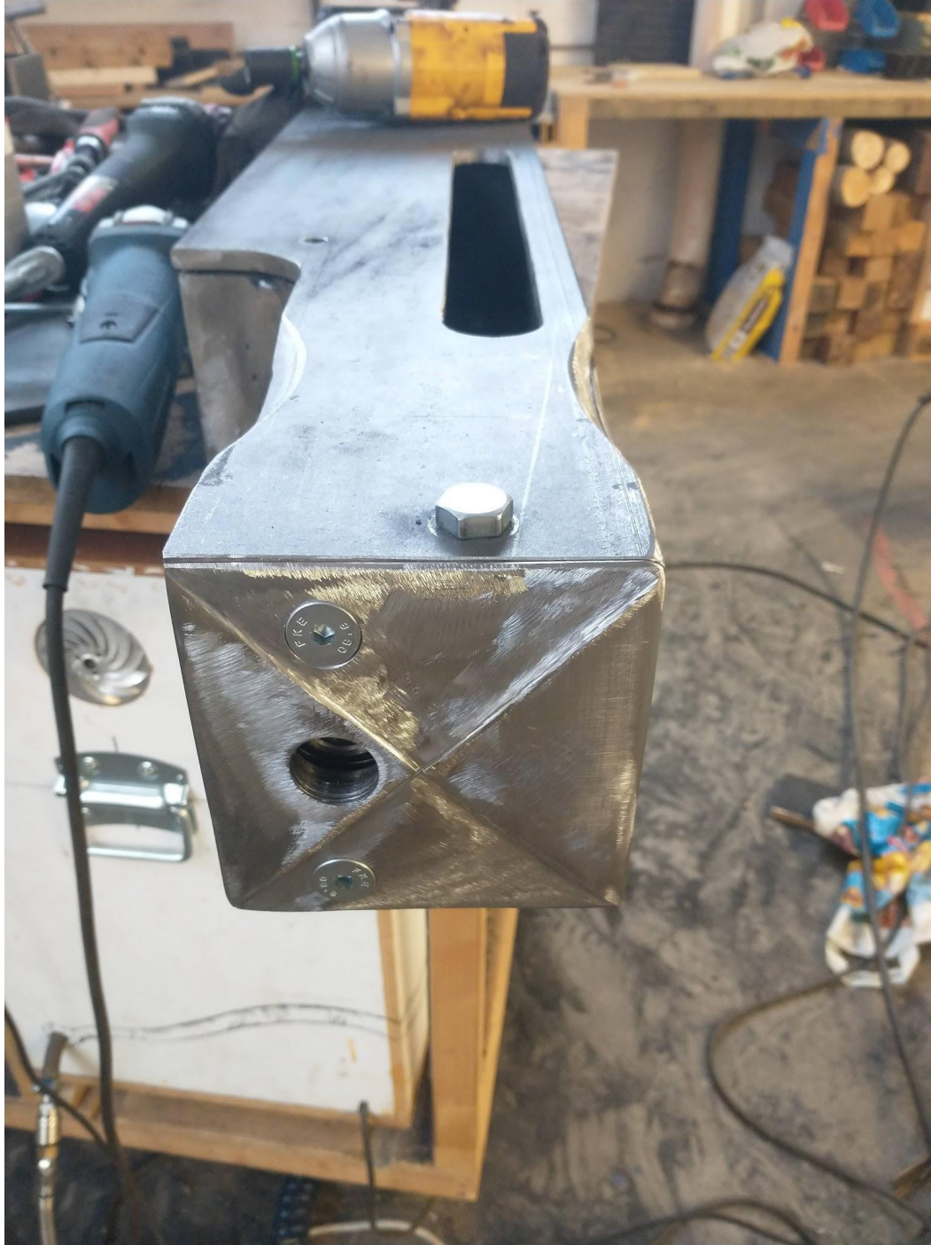
Schuifknecht in aanbouw