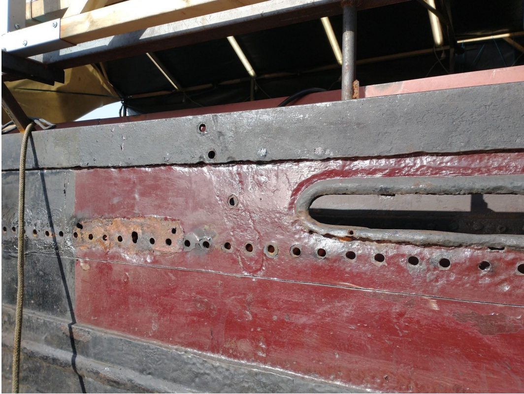
Slecht deel van de bakboord zij. Ter hoogte van het schildpaddenblok en putting.