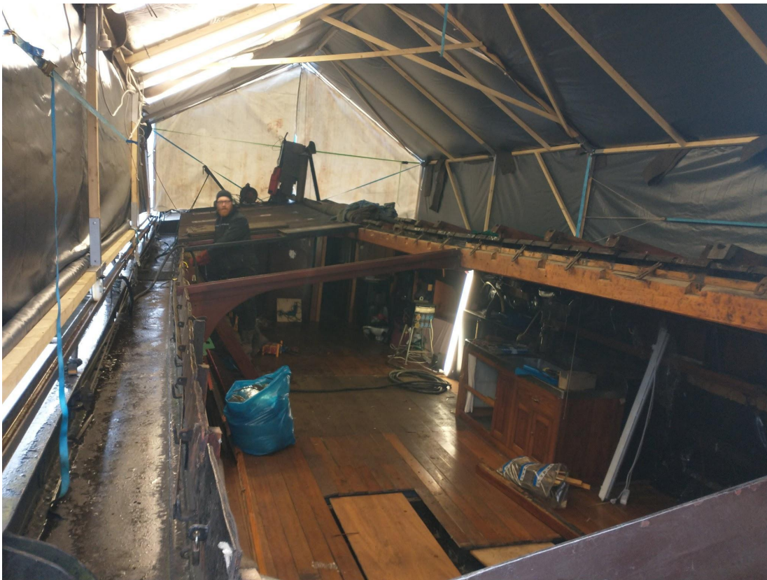
De oude situatie, duidelijke rottigheid tussen den en dendubbeling, oude scheerbalken en gebinten.