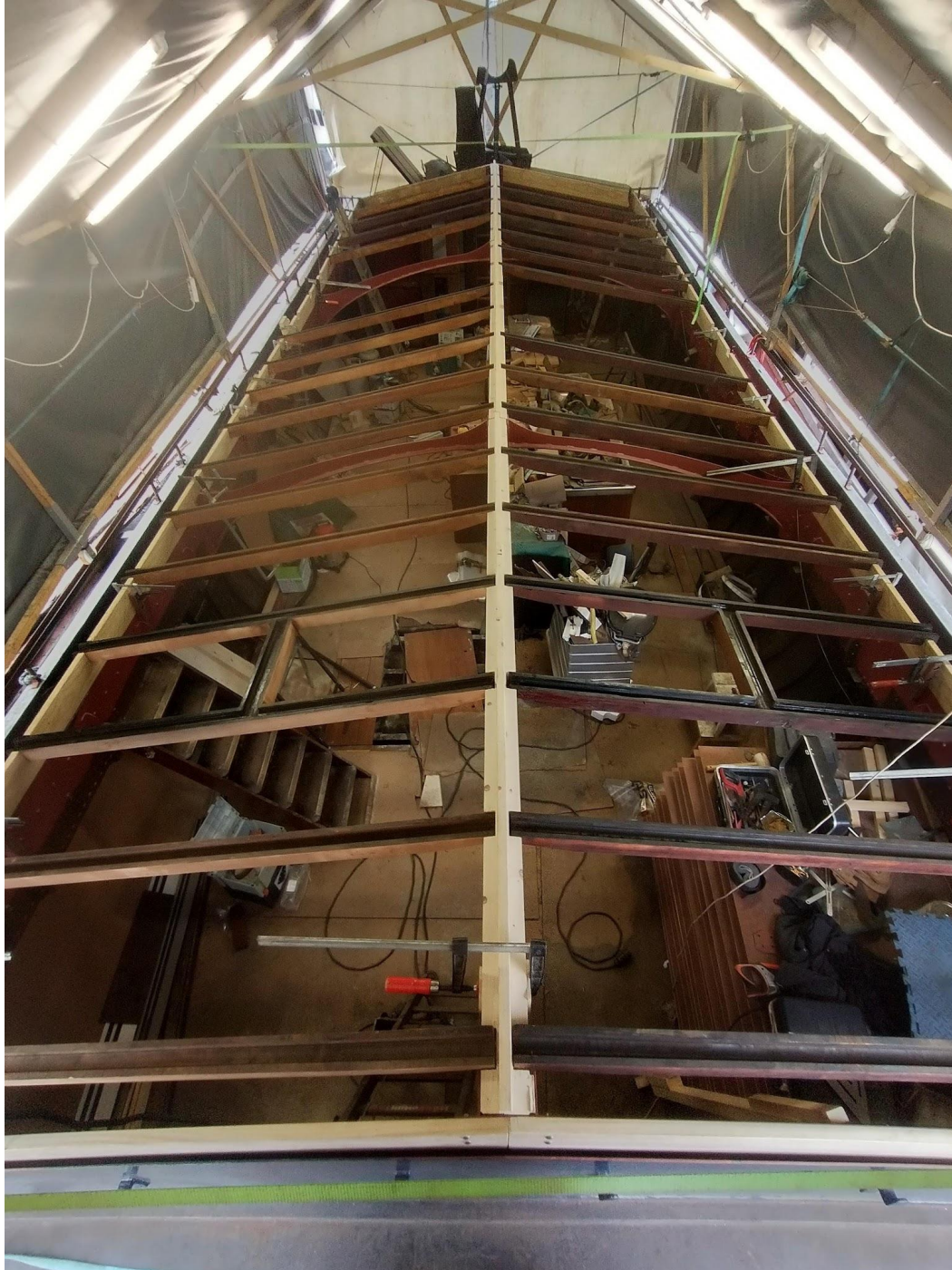
Nieuwe scheerbalken, nieuwe gebinten, nog een aantal merkels bijmaken