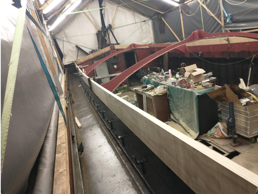
Opbouw langs de zeeg, nog zonder merkelhapjes