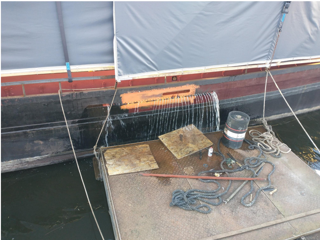
Nieuwe deel zij klinkklaar maken. Even het gangboord spoelen