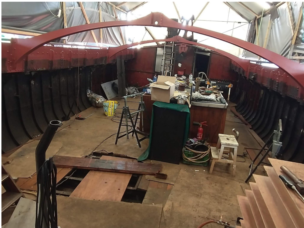
Nieuwe gebinten ingehangen