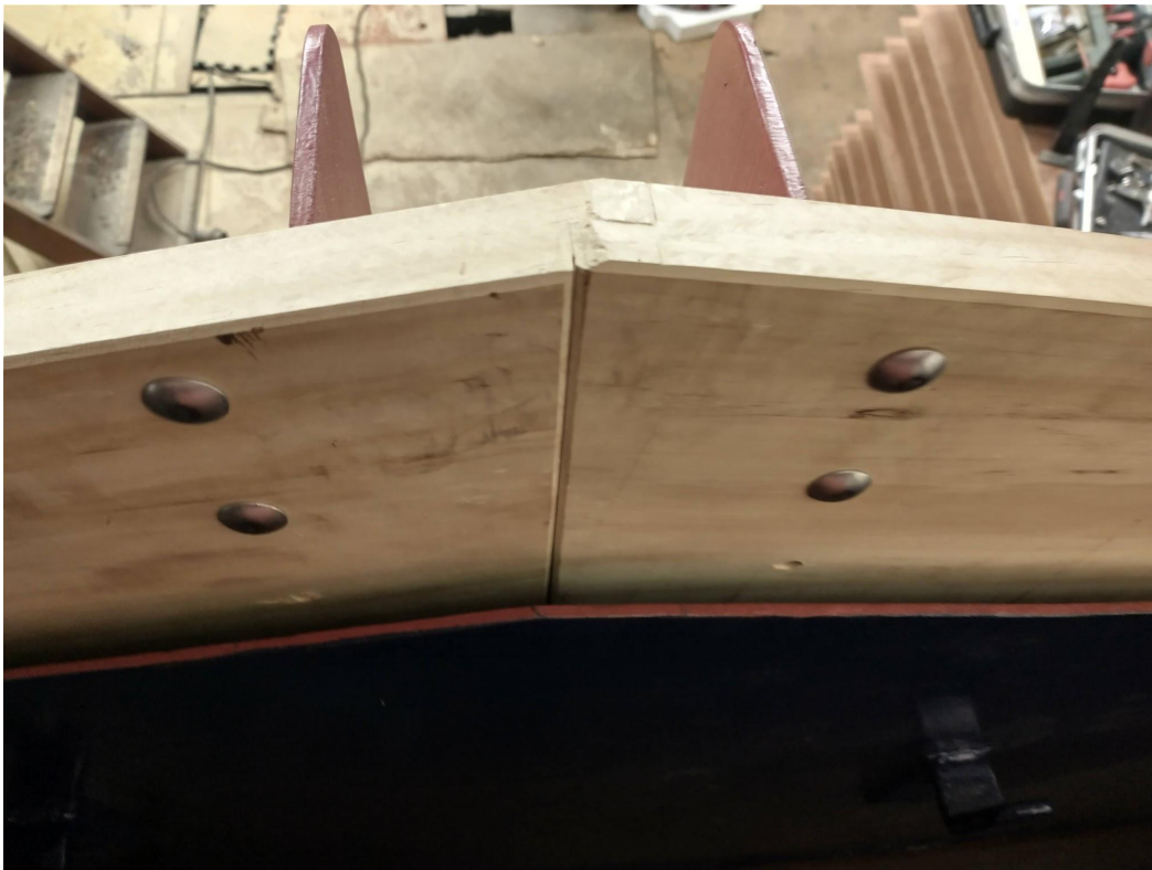
Halfhoutverbinding op het voorschild