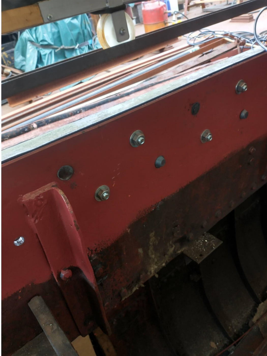
Vers geklonken dendubbeling, om en om geklonken, halverwege de dag.