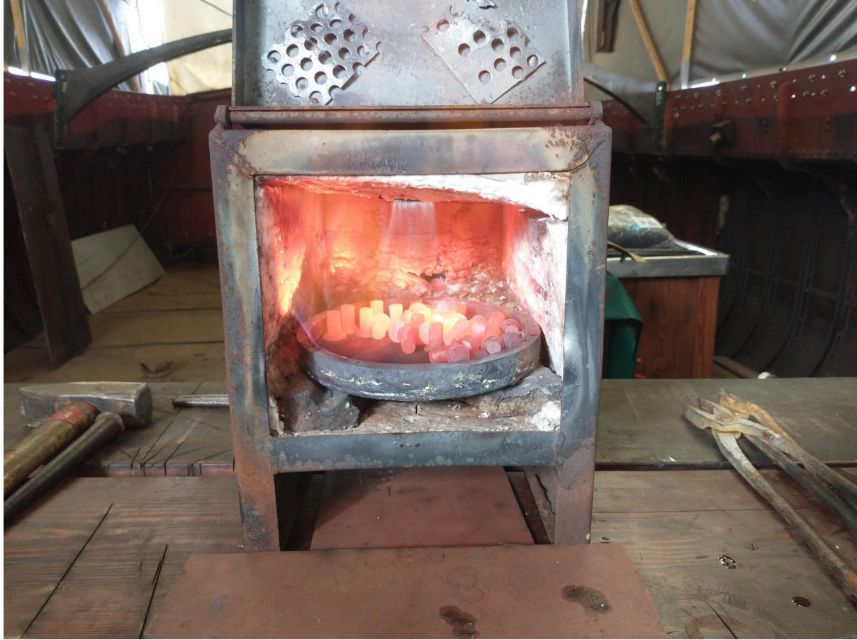
Hete klinknagels, helaas hadden we tijdens het klinken de handen vol.