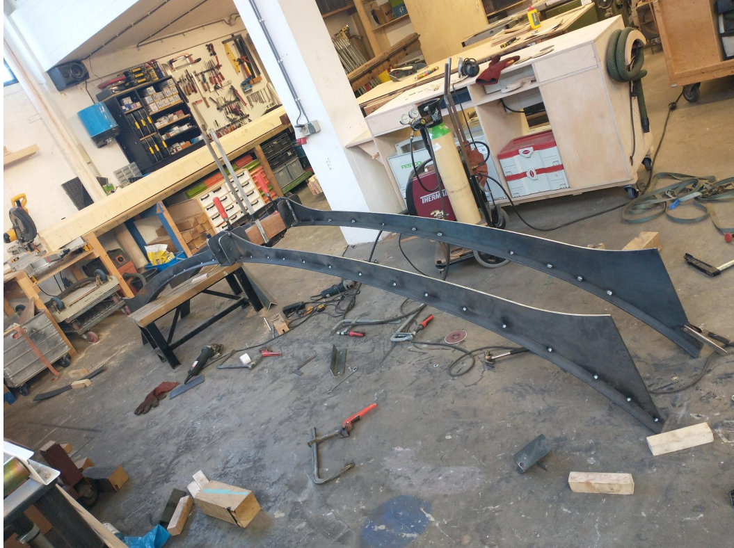
Nieuwe gebinten in aanbouw