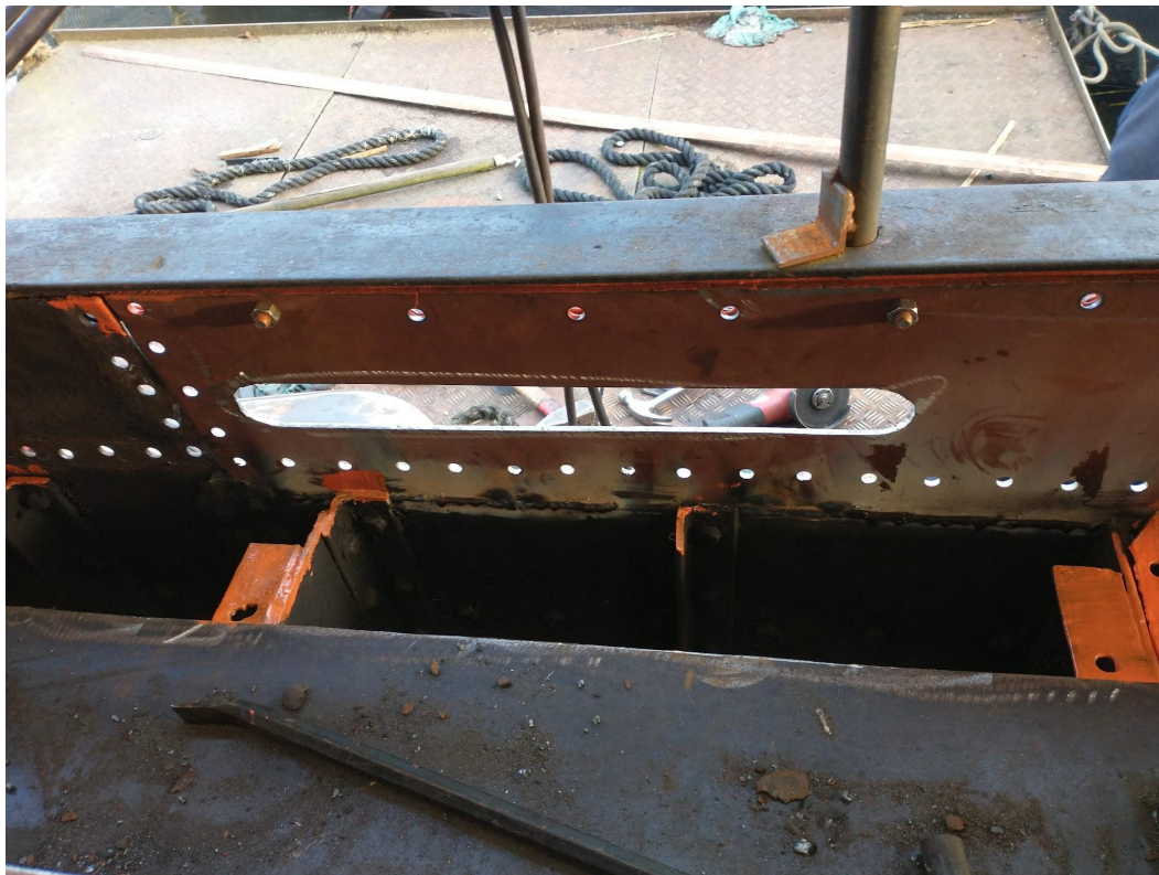
Ook een deel van het gangboord was slecht