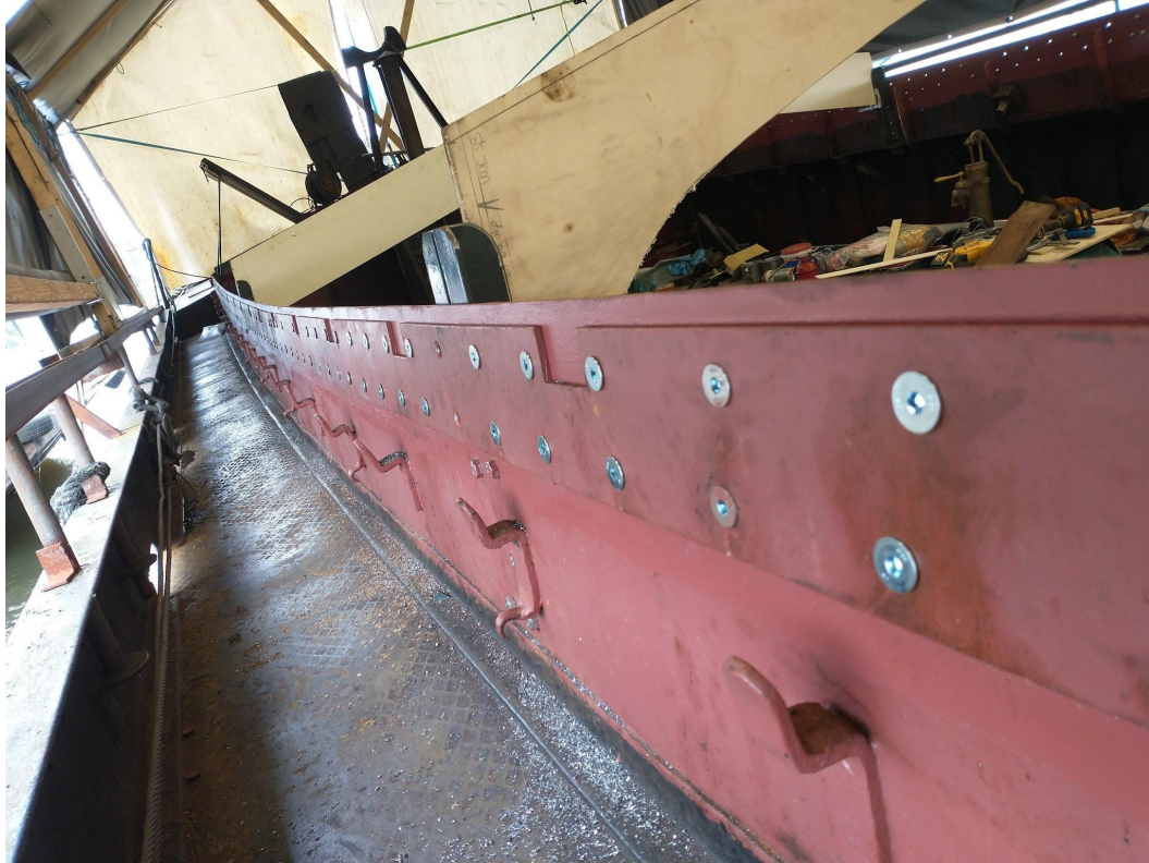
Verse den en dendubbeling, gebout, voorafgaand aan het klinken, op de achtergrond houten mallen voor de nieuwe gebinten.