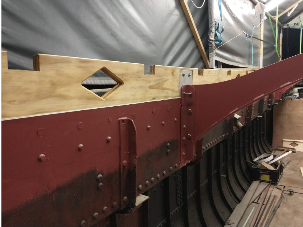
Den geklonken dendubbeling, geklonken gebint-ophanging en accoya opbouw