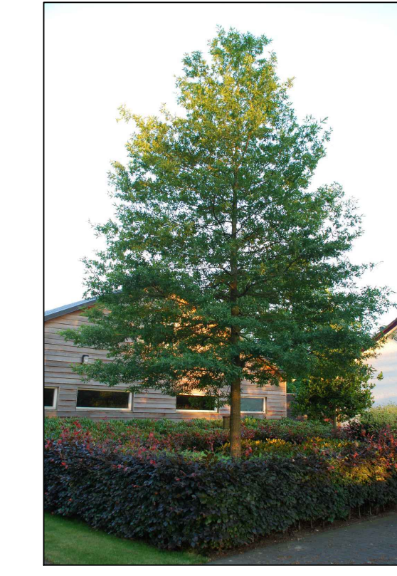
B Quercus phellos