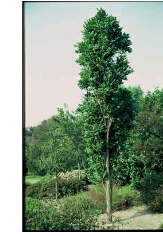
G2 Koelreuteria paniculata 'Fastigiata'