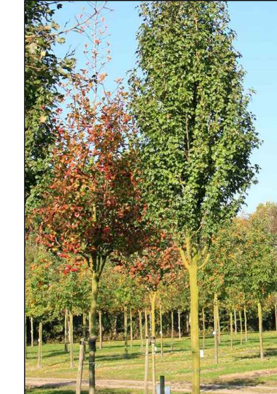
G3 Crataegus monogyna 'Stricta'