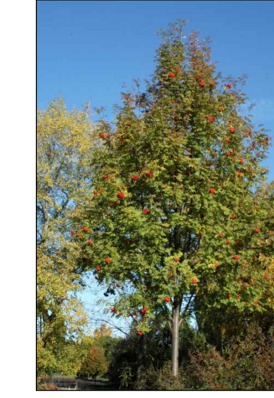
C Sorbus aucuparia