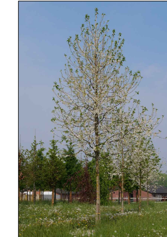
H Halesia monticola