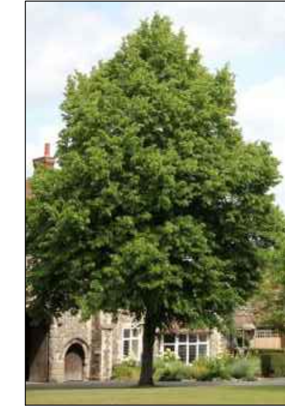
A Tilia x europaea