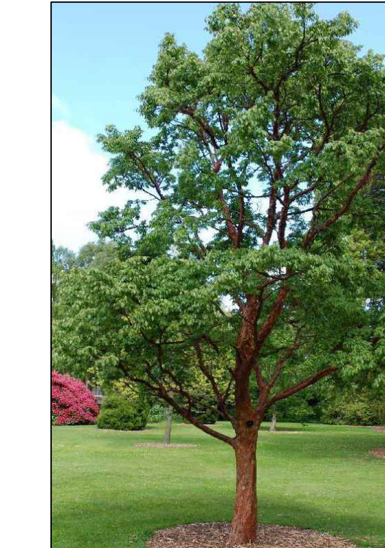
I Acer griseum