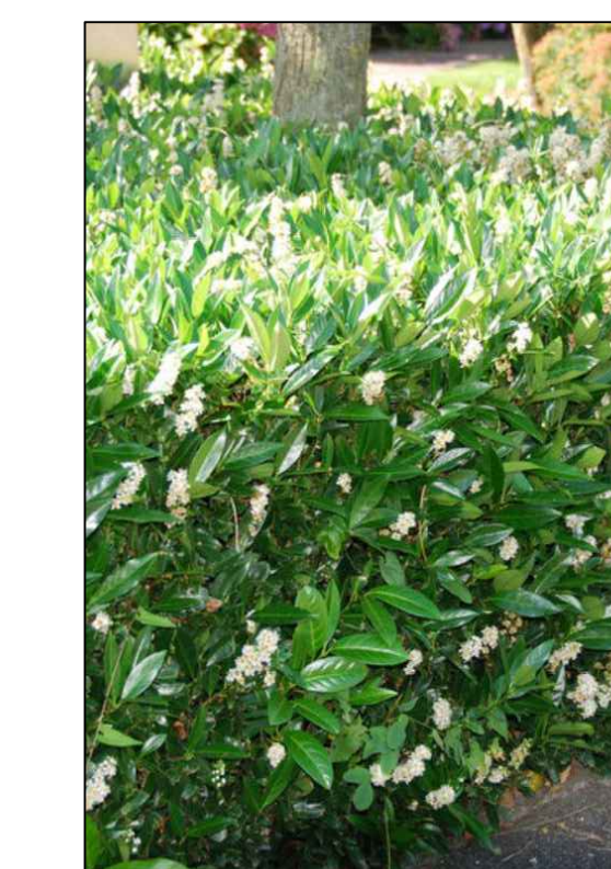
Prunus laurocerasus 'Otto Luyken'