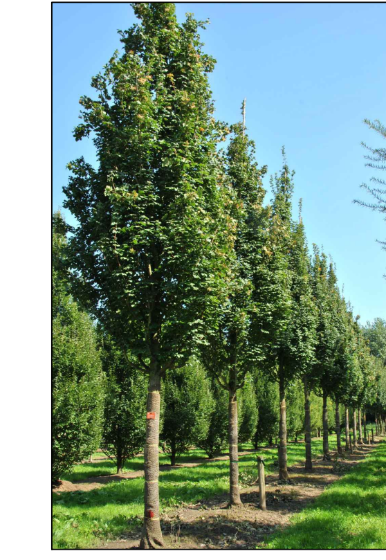
G1 Acer campestre 'Green Column'