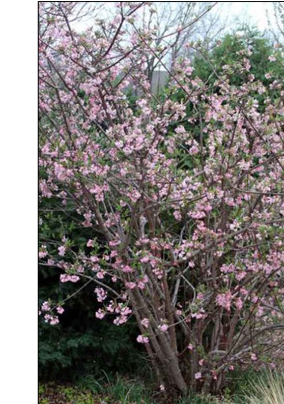
Vf Viburnum farreri