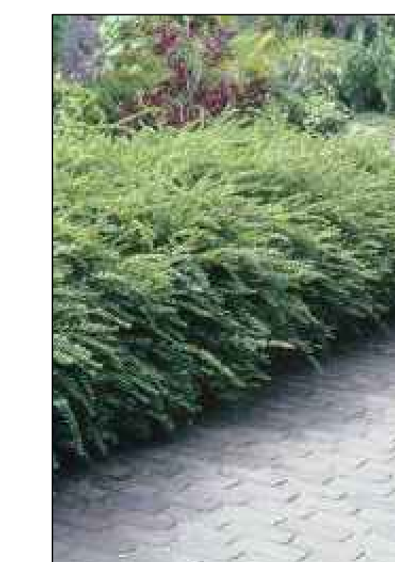
Lonicera nitida 'Maigrün'