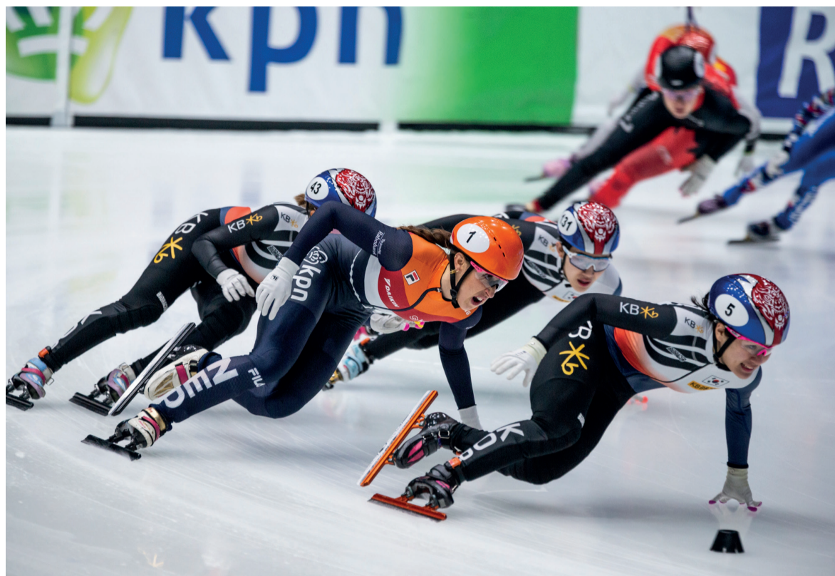
De verwachtingen voor de Nederlandse shorttrackers zijn hooggespannen dit weekend.

Dit weekend is het weer zover! Van 10 tot en met 12 februari is de Sportboulevard in Dordrecht dé schaatstempel van Nederland. Dan vindt de finale van de ISU World Cup Shorttrack 2023 plaats.