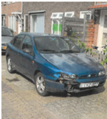
Last onder bestuursdwang voertuig Citroën met het kenteken NOE55MN

Het besluit treedt in werking met ingang van de dag na bekendmaking. Het indienen van een bezwaarschrift houdt de werking van het besluit niet tegen. In spoedeisende gevallen kunnen belanghebbenden de voorzieningenrechter van de Rechtbank Rotterdam, Postbus 50951, 3007 BM Rotterdam verzoeken een voorlopige voorziening (tijdelijke beslissing) te treffen.