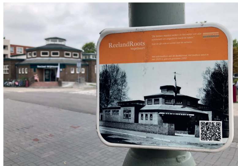
Het oude badhuis op de hoek van de Bankastraat is een van de gebouwen op de lijst.

op welke monumenten het meest is gestemd. Uit die lijst stellen we een top 25 samen. Het college van burgemeester en wethouders wijst uiteindelijk de monumenten aan. Benieuwd wat de keuze is van enkele bekende Dordtenaren? De komende weken laten we in korte filmpjes zien welke gebouwen hún stem krijgen. Deze filmpjes zijn te vinden op het YouTube-kanaal van de gemeente en ook op www.dordrecht.nl/kiesjemonument .