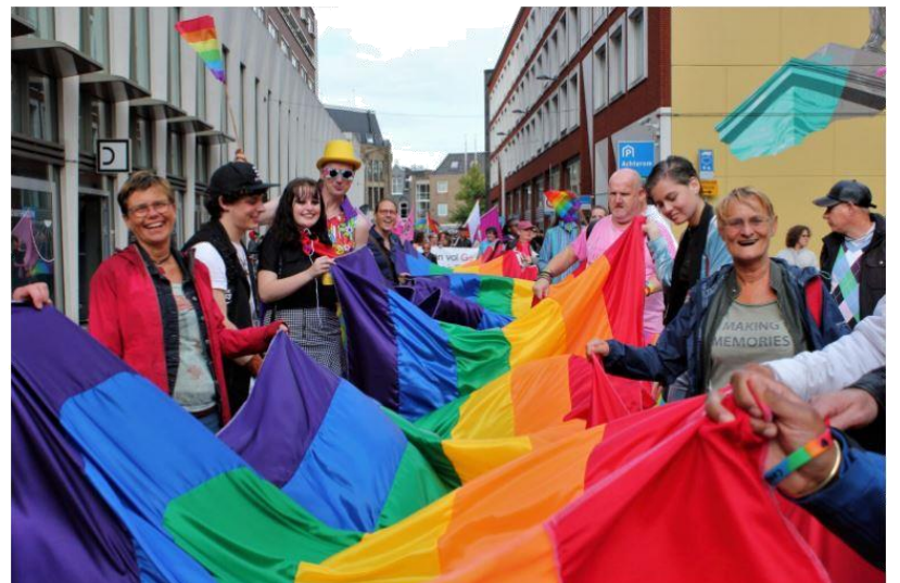
Dordrecht Pride in 2019.

In hoeverre haakt het huidige politiek akkoord nog in op de ambitie zoals eerder geformuleerd?