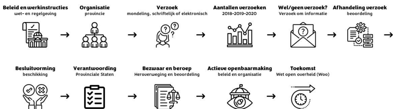
Figuur 2.1. Infographic aanbeveling uitvoering Woo

Dit hoofdstuk beschrijft de nieuwe eisen van de Woo ten opzichte van de Wob. Na bespreking van de algemene bepalingen in paragraaf 2.2 wordt in paragraaf 2.3 en 2.4 ingegaan op de bepalingen over de openbaarmaking van informatie op verzoek en de openbaarmaking van informatie uit eigen beweging. In paragraaf 2.5 komen de bepalingen over de informatiehuishouding aan de orde. Voor een uitgebreidere bespreking van de Woo en de gevolgen daarvan voor decentrale overheden verwijzen wij naar een artikelsgewijze bespreking van de Woo door Van der Sluis en een handreiking van de Vereniging van Nederlandse Gemeenten (VNG). 5 De handreiking doet tevens concrete aanbevelingen voor de uitvoering van de Woo.