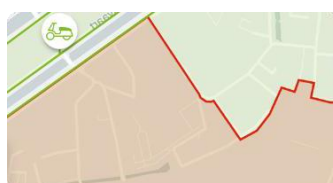
Geen parkeergebied (rood)